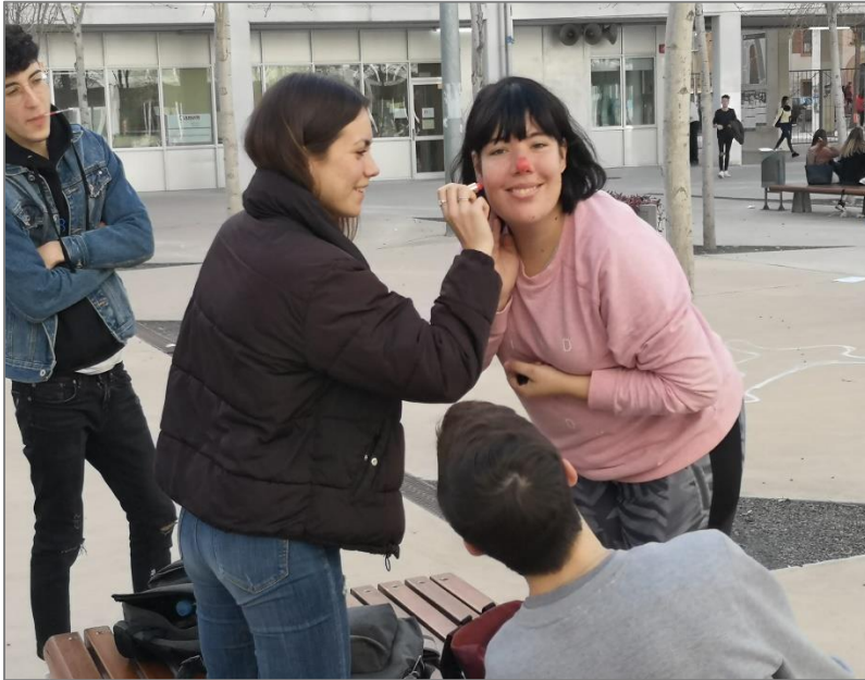
Treball en equip (curs 2019-2020).